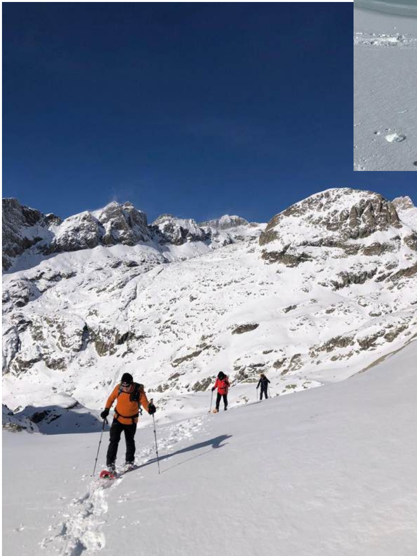
La troupe en train de monter vers le lac Niré, le Mt Rond en toile de fond