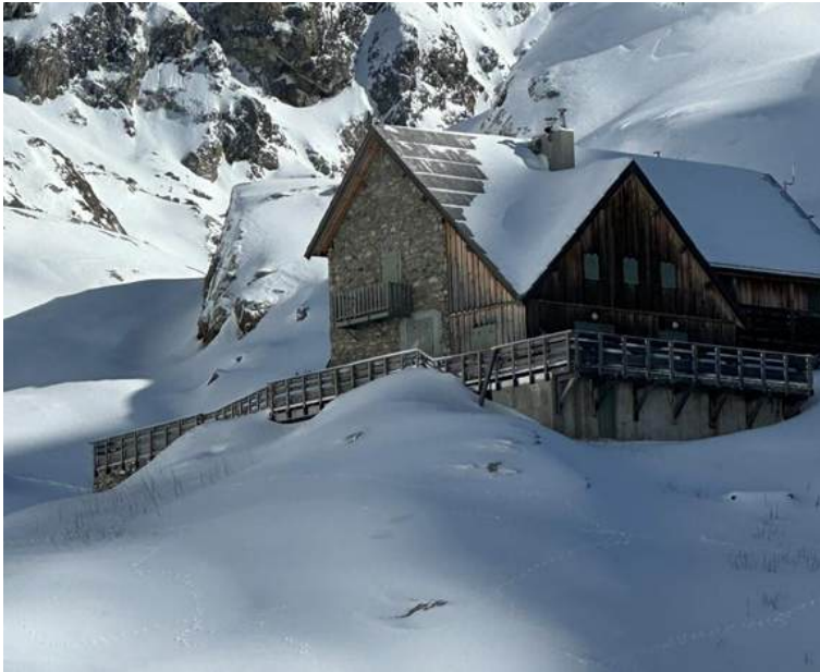
Le refuge de Nice sous la neige

De la neige fraîche, un ciel limpide, que demander de plus ?