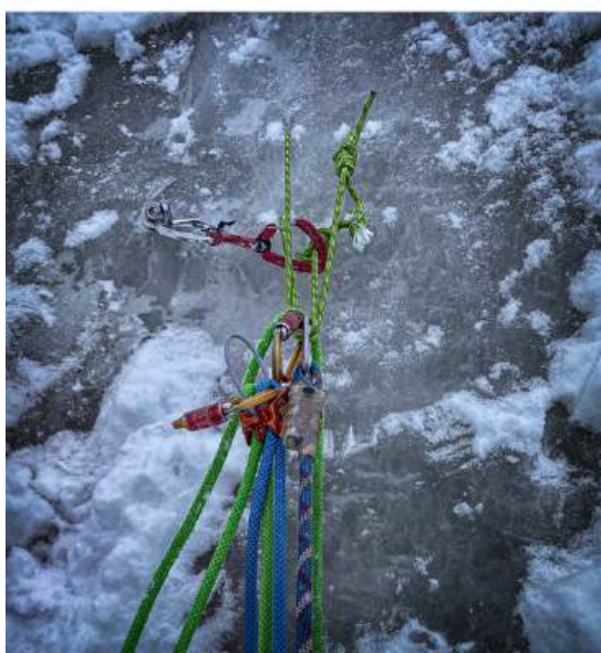
Magnifique relais abalakov

Janvier c'est la saison des cascades de glace, aussi fascinantes qu'éphémères. Le club a su profiter de cette courte saison pour proposer 3 séjours!